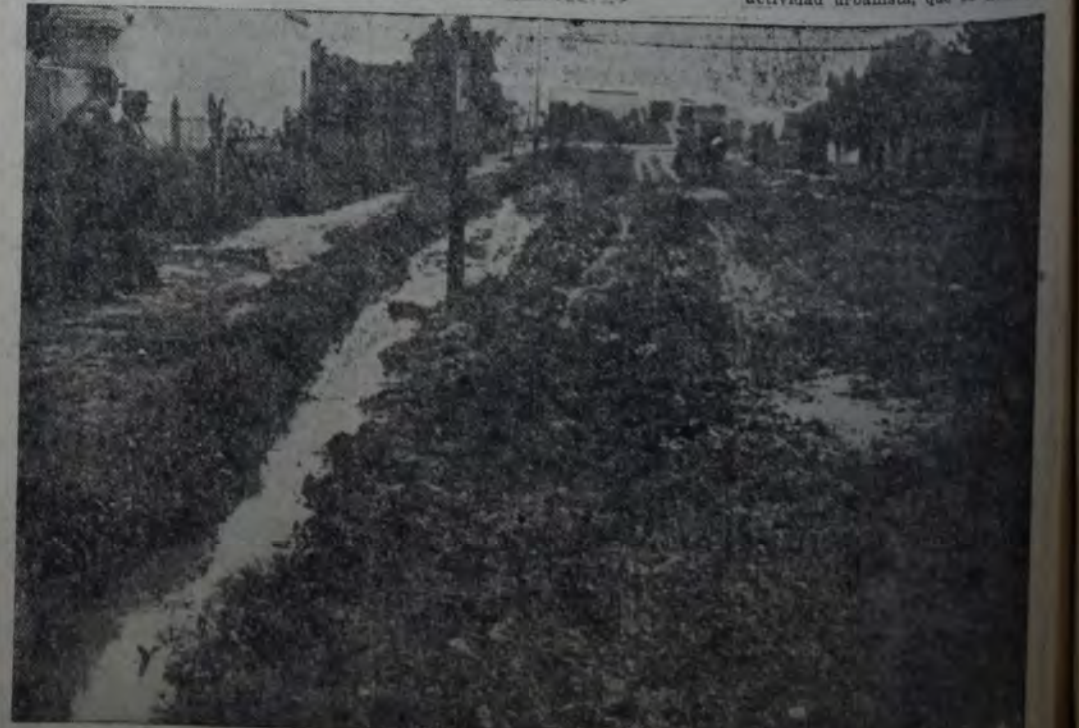
GAONA Y MOLIERE. LA ZANJA DE DESAGÜE, POR FALTA DE UNA LIMPIEZA REGULAR, HA IDO RELLENÁNDOSE DE TIERRA Y BASURA y está hoy a nivel de la calle. Para remediar el mal, en Molière, tocando a Gaona y frente mismo al puente sobre el arroyo Maldonado, se ha formado un enorme pozo que dificulta el tránsito de peatones en día normal, y lo hace peligroso en días de lluvia.