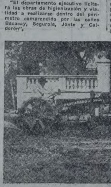
HE AQUÍ EL TRACTOR RECIENTEMENTE COMPRADO POR LA SOCIEDAD de fomento "Villa Luro Norte", trabajando en el abovedamiento de la calle Molliere. ¿Será esta lección gráfica un estimulante para el departamento ejecutivo municipal? No creemos mucho en su sensibilidad!

"El departamento ejecutivo licitará las obras de higienización y vialidad a realizarse dentro del perímetro comprendido por las calles Bacacay, Seguroia, Jonte y Calderón".