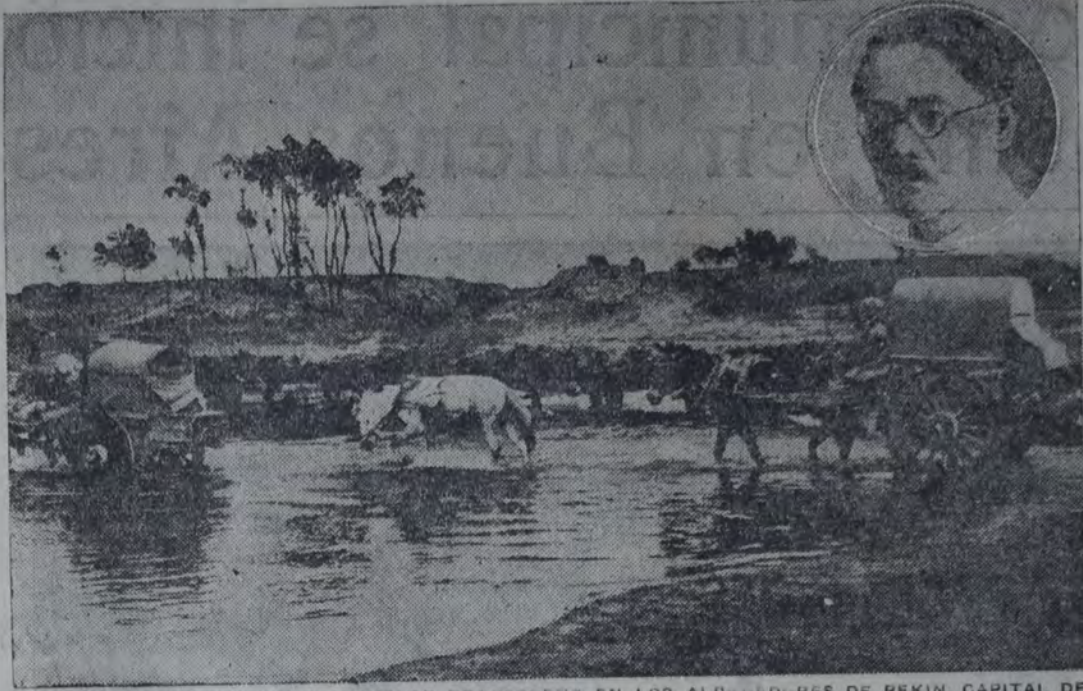
CARROS UTILIZADOS COMO MEDIO DE TRANSPORTE EN LOS ALREDEDORES DE PEKIN, CAPITAL DE CHINA. — Arriba en círculo: Sun Yat Sen, apóstol de la unidad y la libertad del pueblo chino.

El pueblo chino se aproxima a la realización del sueño de Sun Yat Sen: la unidad y la libertad. La clase trabajadora del mundo entero ha seguido con simpatía el avance del ejército del sur hasta su entrada triunfal en Pekín; siempre ha reclamado que se hiciera resaltar el carácter imperialista de la política extranjera en China, y que las potencias reconocieran la independencia y la igualdad de derechos de esa gran nación del Levante. En adelante, toda tentativa de la diplomacia europea para mantener los antiguos tratados de violencia y coerción chocarán con la más resuelta oposición del proletariado internacional, puesto que el Congreso de Bruselas, en varias de sus resoluciones, ha expresado la solidaridad del movimiento socialista obrero europeo con la democracia china.