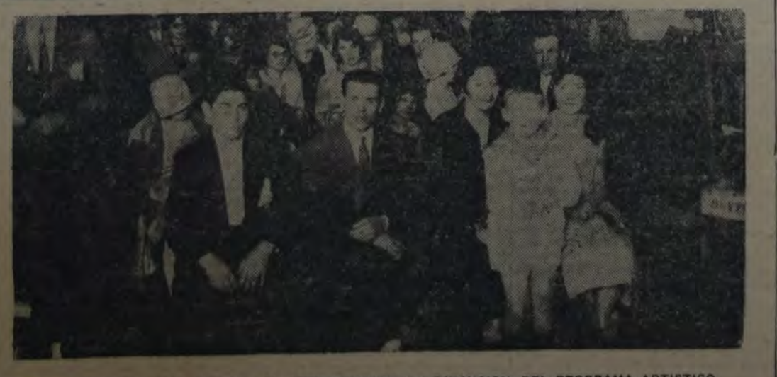
LA CONCURRENCIA QUE ASISTIO AL ACTO DURANTE LA EJECUCION DEL PROGRAMA ARTISTICO