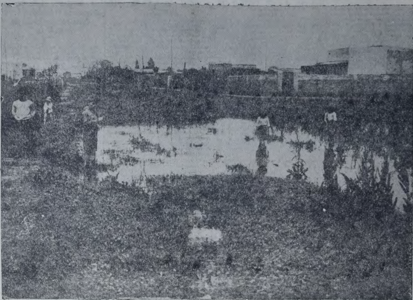
LA GRAN LAGUNA DE LA CALLE MIRANDA, ENTRE BERMUDEZ Y CERVANTES. FUE TOMADA LA FOTOGRAFIA UN DIA DE HERMOSO SOL, muchos después de la lluvia. Por este antecedente, ya se imaginará el lector cómo estará eso en los días de fuerte lluvia. Ahora, los chicos del barrio pescan ranas. Y entonces, ¿qué familia de peces no estará en ella representada? ... Aunque Villa Luro es el barrio de los poetas — Víctor Hugo, Molière, Lope de Vega, Calderón, Cervantes — no le va, por eso, mejor. Los poetas siempre han querido mucho y podido poco!...