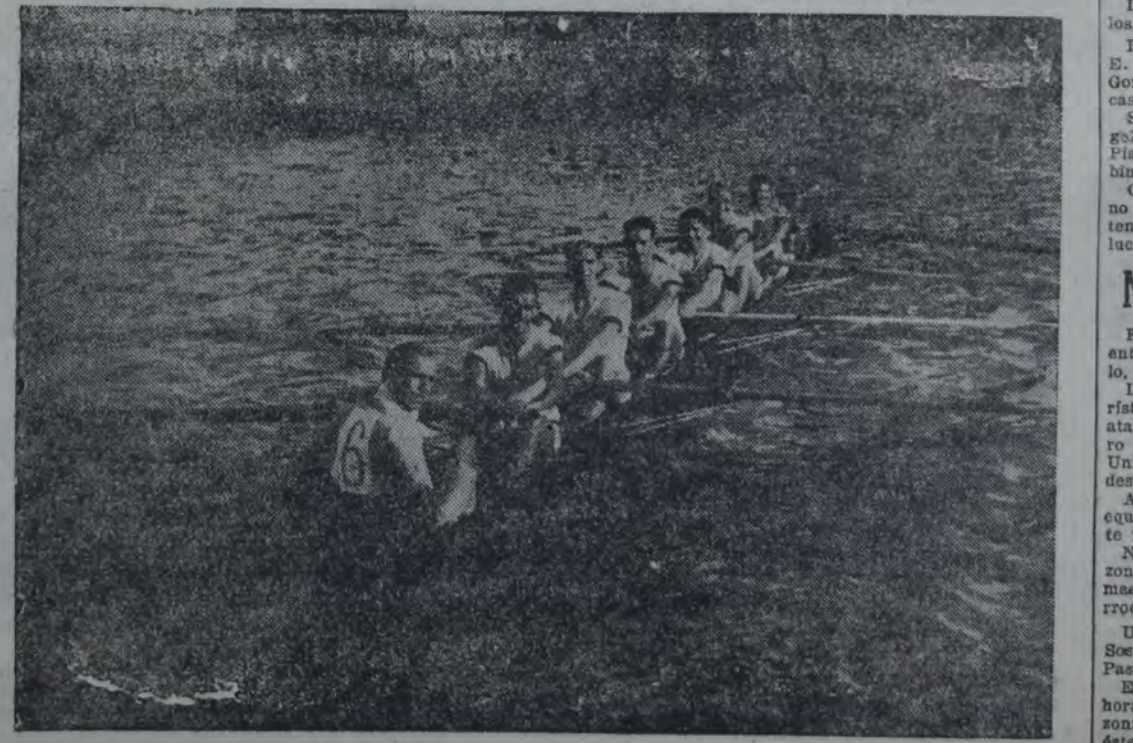
TRIPULACION DEL CLUB CANOTTIERI ITALIANO, GANADOR DE LA sexta regata, reservada para botes de ocho remos largos.

En el río Luján verificáronse ayer las pruebas organizadas por la Comisión de la regata internacional del Tigre.