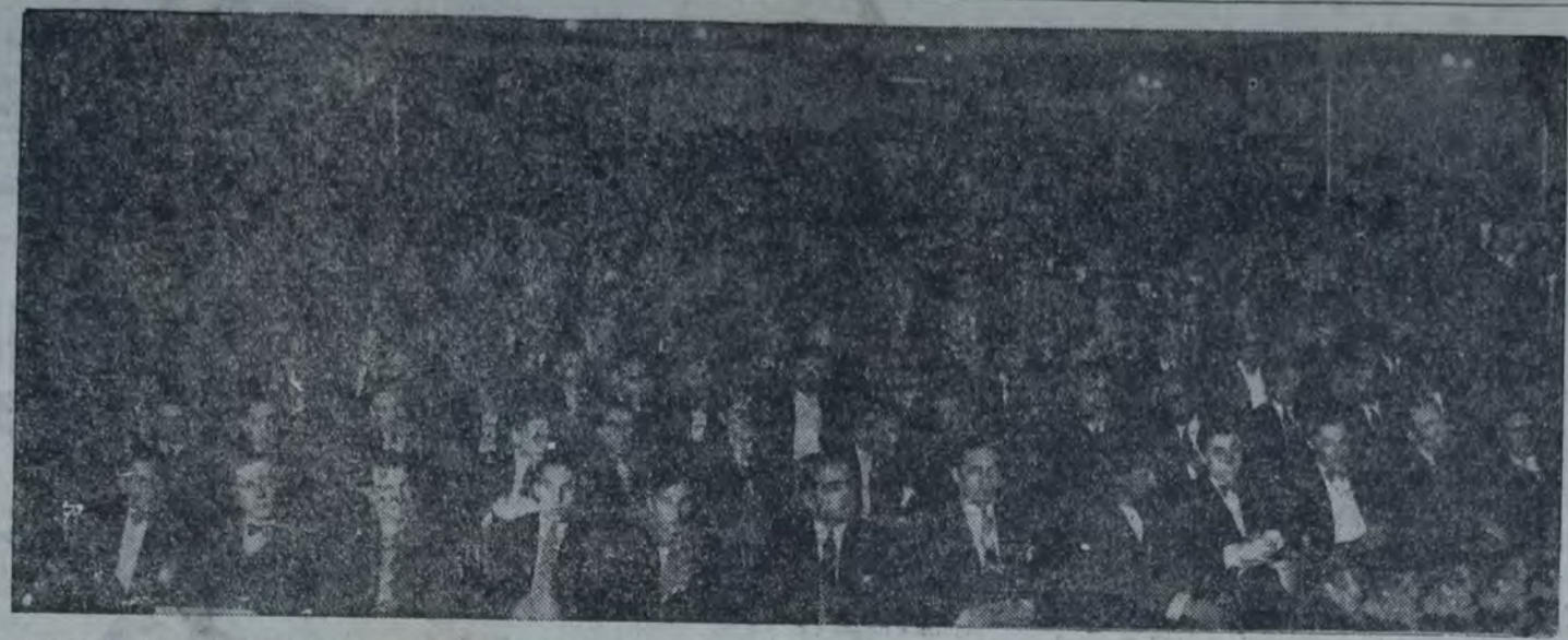
ASPECTO QUE PRESENTABA LA PLATEA DEL TEATRO VARIEDADES DURANTE LA ASAMBLEA REALIZADA AYER, EN LA CUAL SE RESOLVIÓ presentar el miércoles próximo el nuevo pliego de condiciones. La crónica de este importante acto gremial aparece en la tercera página.

Garay y Boedo. Ante una numerosa concurrencia se realizó este acto. El secretario del Cen-